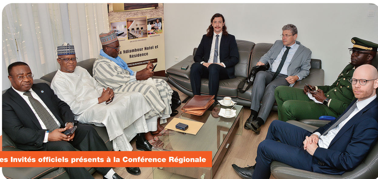
Les Invités officiels présents à la Conférence Régionale

L'expérience régionale montre clairement que l'efficacité de la lutte contre les menaces transfrontalières dépend moins de la fermeture des frontières que de la capacité à renforcer la cohésion sociale dans les espaces frontaliers. Les organisations régionales et sous-régionales ont un rôle clé à jouer pour transformer l'alerte communautaire en action coordonnée, inclusive et préventive, en plaçant les populations frontalières non pas comme un problème, mais comme des partenaires centraux de la sécurité régionale.