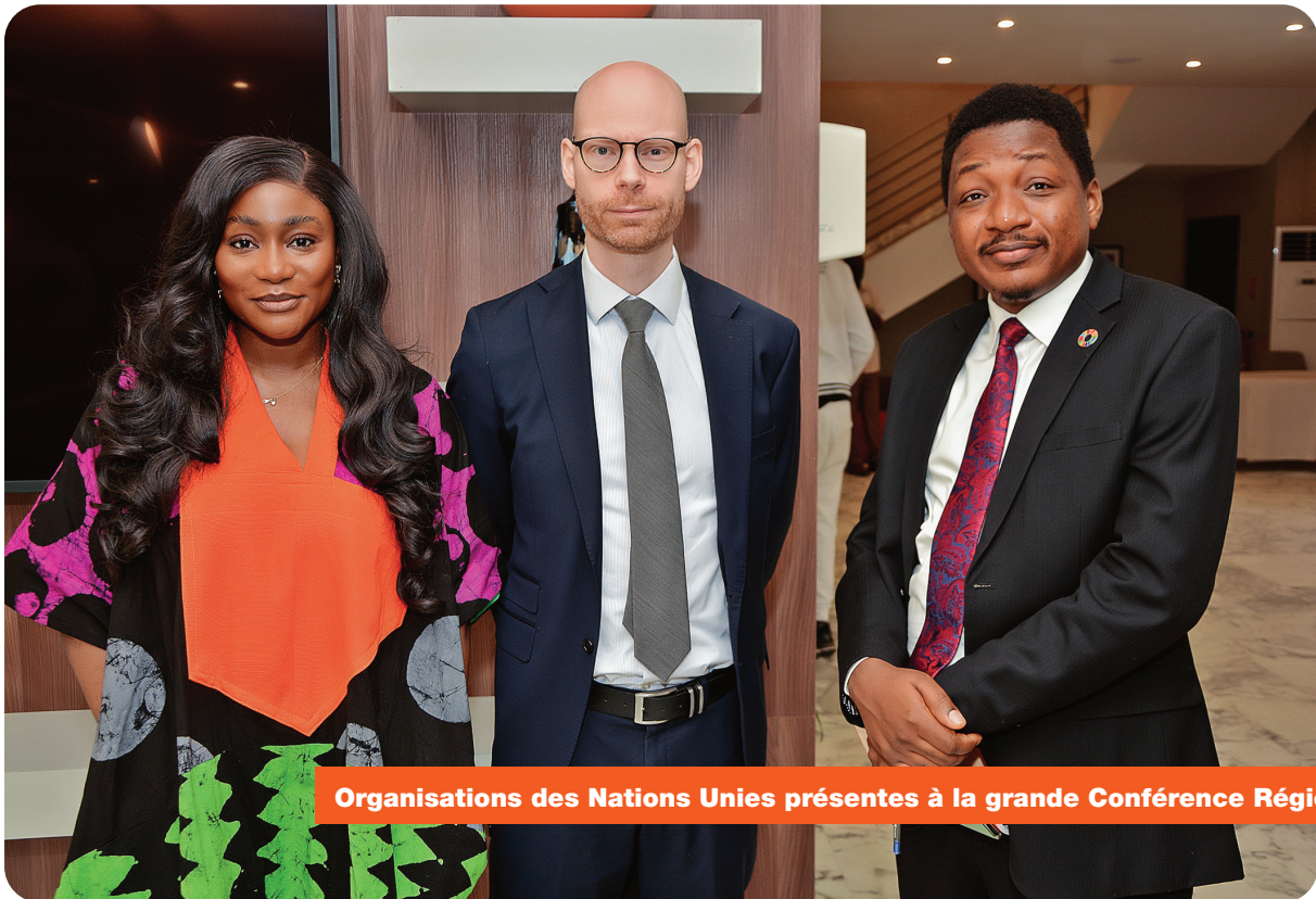
Organisations des Nations Unies présentes à la grande Conférence Régionale