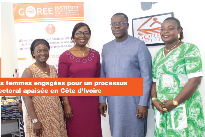
Les femmes engagées pour un processus électoral apaisé en Côte d'Ivoire

Promouvoir des cadres politiques favorisant une information exacte et pluraliste. Cela implique de soutenir les médias indépendants pour contrecarrer la concentration de la propriété des médias et garantir des sources de revenus viables. Il faut aussi exiger des grandes plateformes numériques qu'elles rendent leurs systèmes de recommandation plus transparents et qu'elles offrent des interfaces fiables aux chercheurs et aux régulateurs. Pour se faire, on doit protéger les droits à la liberté d'expression, de réunion pacifique et d'association en soutenant les défenseurs des droits de l'homme, les journalistes et les lanceurs d'alerte contre les représailles.