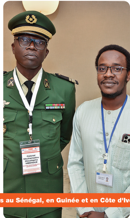
Conférence Régionale : Représentants d'organisations au Sénégal, en Guinée et en Côte d'Ivoire