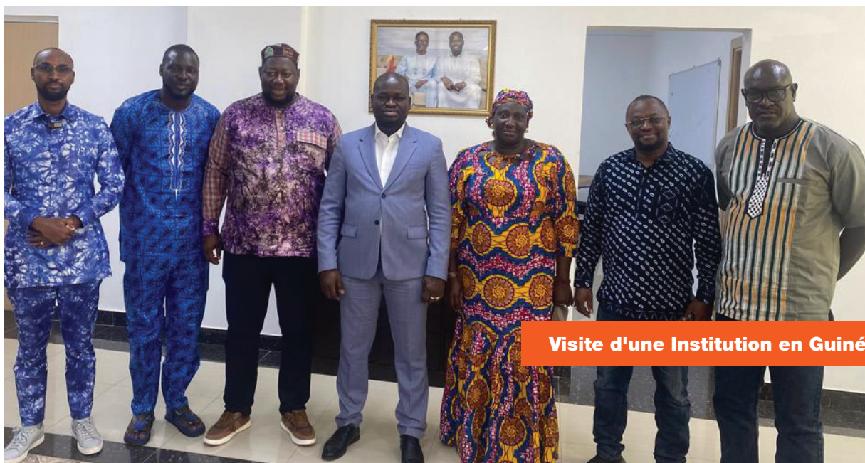
Visite d'une Institution en Guinée

Repenser la démocratie en contexte d'instabilité : quelles stratégies pour une gouvernance endogène et inclusive en Afrique de l'Ouest et au Sahel ?