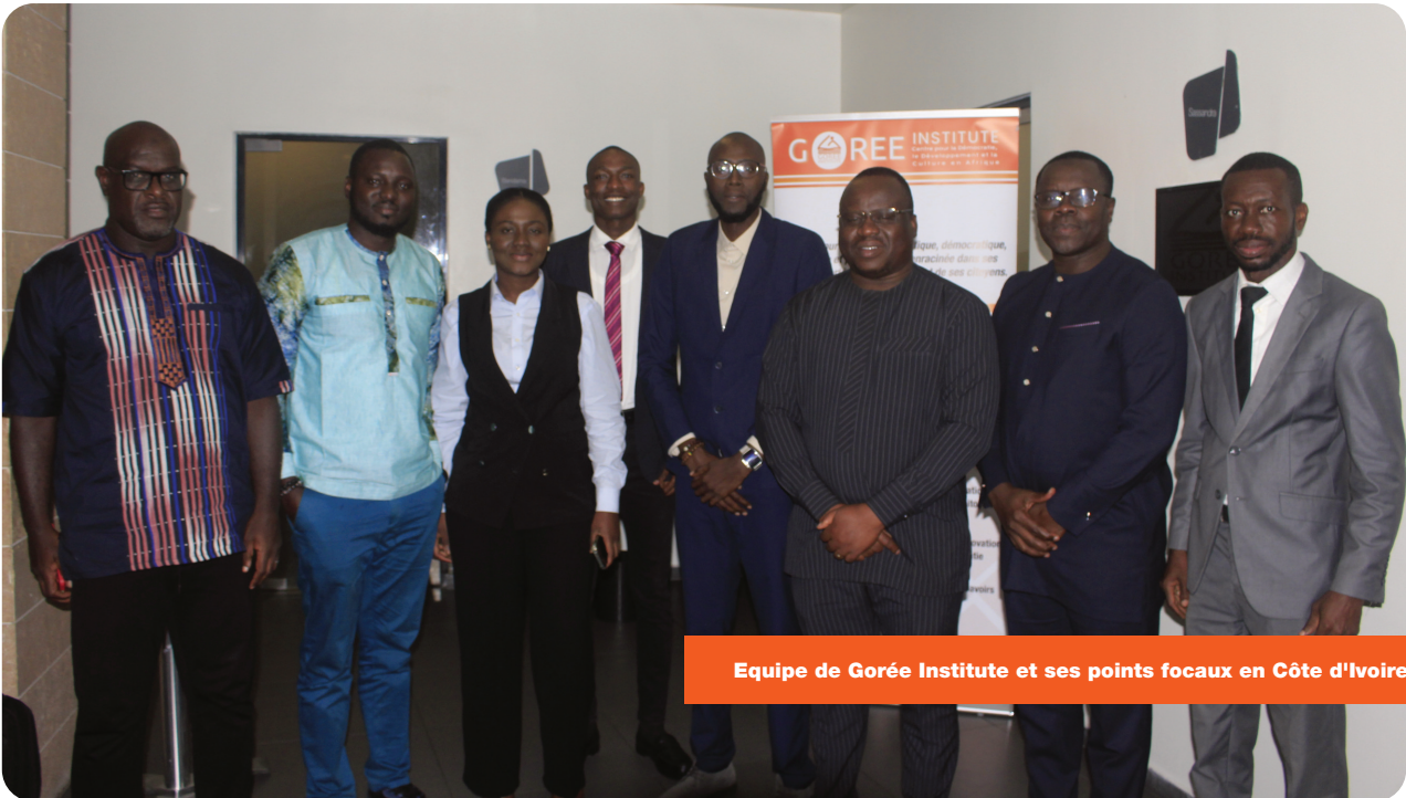
Equipe de Gorée Institute et ses points focaux en Côte d'Ivoire

Pour terminer, l'inclusion des femmes et des jeunes dans les processus démocratiques n'est pas seulement une question de justice sociale, mais aussi de stabilité politique et de développement. Une démocratie véritablement inclusive est celle qui permet à toutes et à tous, indépendamment de leur genre ou de leur âge, de participer pleinement à la gestion des affaires publiques