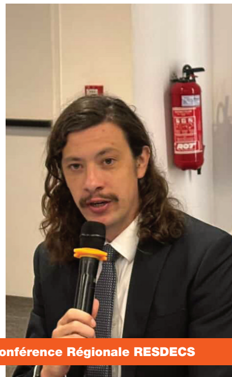
Conférence Régionale RESEDCS