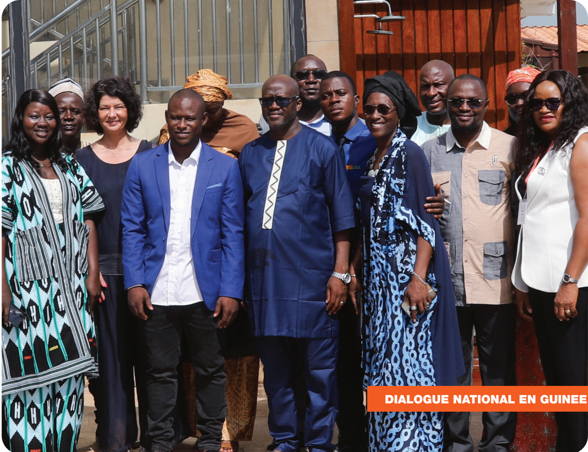
DIALOGUE NATIONAL EN GUINEE

Pour remédier à cet affaiblissement de l'État, les panélistes préconisent une refondation du contrat social. En somme, ces communications proposent des solutions stratégiques pour transformer la gouvernance et garantir une stabilité durable dans la région.